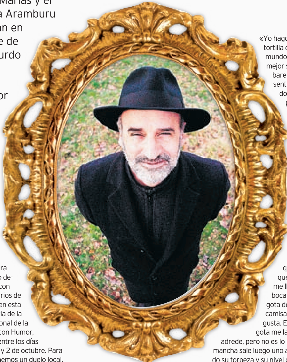
El donostiarra, visto desde arriba.

El espejo de su casa en Bilbao, cuando está de buen humor, es el rincón del País Vasco preferido del primero. Este rasgo, tan bochero, lo razona en un sentido poético. Su colega no se va muy lejos. Primero, la risa floja, luego, una con más empaque y, por fin, unas risota-